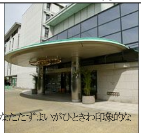
閑静なたたずまいがひととき印象的な青山 ホテルフロラシオン青山は、絶好のロケーションにふさわしい優雅であたたかなホテルです。